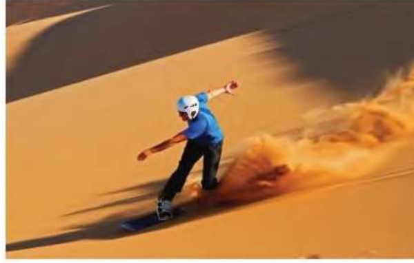
صورة رقم (2-2) توضح نشاط رياضي حر غير منظم عادة يكون للترويح في أوقات الفراغ

وهذا النوع من النشاط غير مخطط له وينفذ بشكل ذاتي من قبل الأفراد. ومن الأمثلة الشائعة لهذا النوع اللعب في الحدائق أو فناء المنزل أو ركوب الدراجة الهوائية.