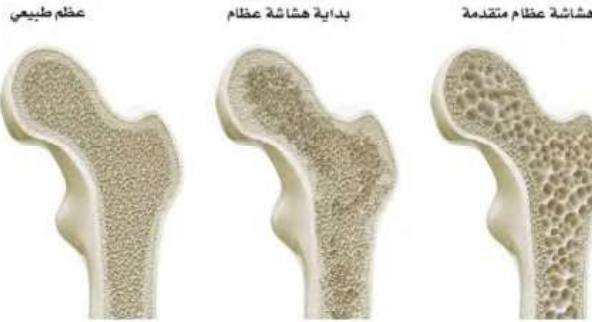
الشكل (6-2) مراحل تطور هشاشة العظام

العظام كغيرها من أنسجة الجسم تتأثر بالخمول البدني وقلة الحركة على المدى الطويل، مما يؤدي إلى ضعفها وسهولة كسرها، ويوضح الشكل رقم (6-2) مراحل تطور هشاشة العظام.