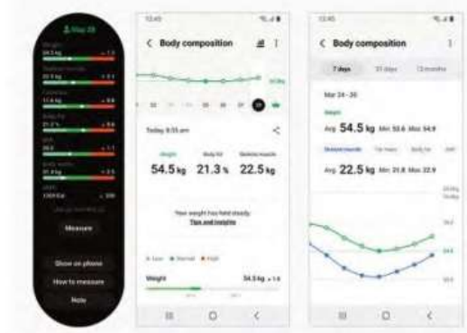
صورة رقم (7-2) نموذج للمعلومات التي تقدمها إحدى التطبيقات الخاصة بتتبع النشاط البدني

1. دقة القياس (Accuracy of Measurement): ويقصد به دقة المعلومات المتعلقة ببيانات النشاط البدني كعدد الخطوات، ومدة النشاط البدني وشدته، والمسافة المقطوعة، وسرعة الأداء كالمشي أو الجري، والقياسات الحيوية كقياس ضربات القلب وغيرها.