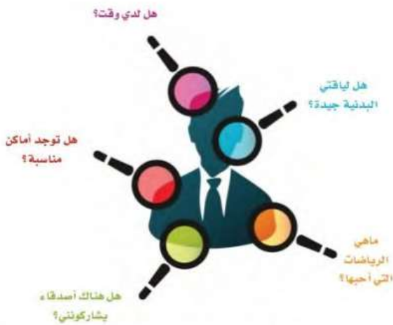
صورة رقم (11-2) مجموعة من المعلومات التي يجب تحديدها عند التخطيط لإعداد برنامج نشاط بدني رياضي