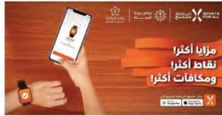
صورة رقم (2-9) دعوة من الاتحاد السعودي للرياضة للجميع للانضمام في إحدى تطبيقات النشاط البدني

الربط مع الهواتف الذكية والحاسوب (Connectivity): ربط الأجهزة بالتطبيقات الإلكترونية سواء كان نظام التشغيل أبل (IOS) أو أندرويد (Android)، باستخدام الوسائط أو الوصلات (كابلوتوث) ويكن مشاركة البيانات ونقلها وتعديلها وإعادتها.