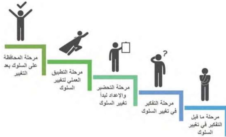
الشكل رقم (2-8) نموذج مراحل تغيير السلوك