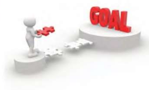
صورة رقم (10-2) مواصفات الهدف الذكي