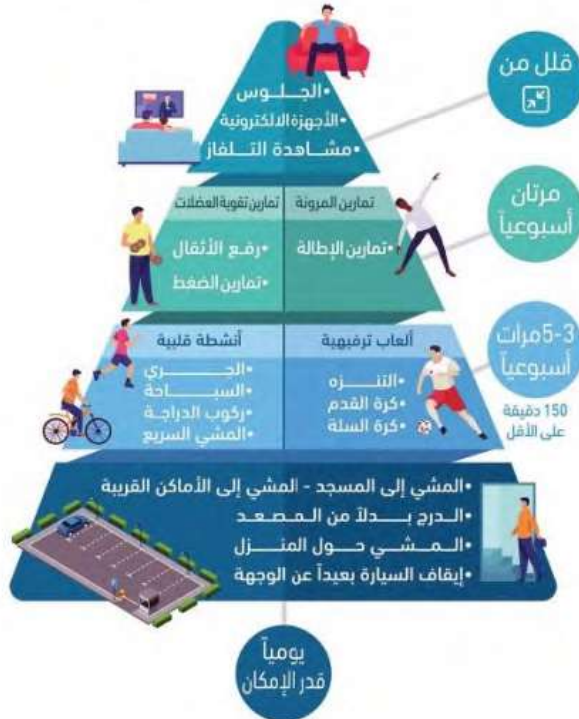
الشكل رقم (2-7) هرم النشاط البدني ومستوى ممارسة كل جزء فيه