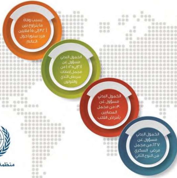
الشكل رقم (2-4) ملخص لأحد تقارير منظمة الصحة العالمية حول أضرار الخمول البدني على الصحة