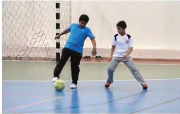
صورة رقم (1-2) نشاط رياضي مدرسي منظم تحت إشراف معلم التربية البدنية

هذا النوع من النشاط مخطط له وينفذ تحت توجيه وإشراف مدرب أو معلم التربية البدنية، كما يمكن أن يكون لهذا النوع من النشاط البدني أهداف وأغراض محددة مسبقاً، مثلما يحدث داخل دروس التربية البدنية أو في حصص التمرينات البدنية في المراكز الرياضية.