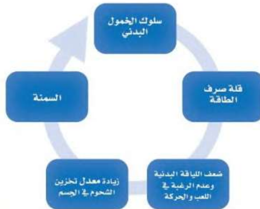
الشكل رقم (2-5) يوضح سلسلة الأضرار الصحية للخمول البدني

عندما يركن الفرد للخمول تبدأ في جسمه سلسلة من المتغيرات التي تساعد على تخزين الفائض من الطاقة في الجسم على شكل شحوم، مما يؤدي إلى حدوث السمنة، والشكل رقم (2-5) يوضح علاقة الخمول البدني بالسمنة.