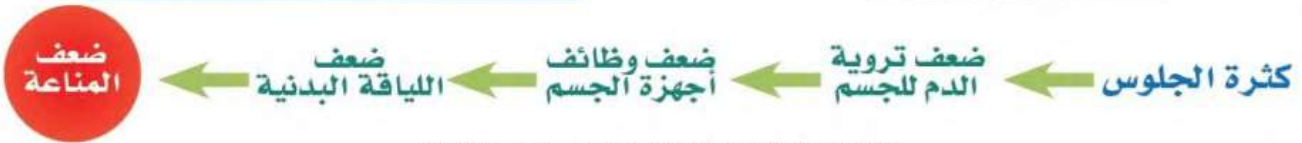
الشكل رقم (2-3) يوضح آثار الخمول البدني على جسم الإنسان