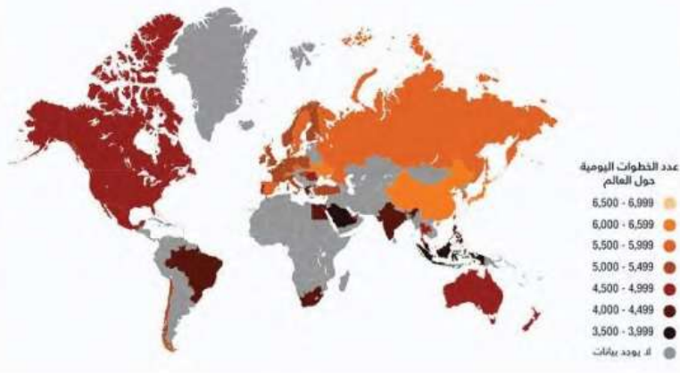
الشكل رقم (2-2) يوضح معدل عدد الخطوات في اليوم حول العالم.

تشير الإحصاءات والدراسات الوطنية والعالمية الحديثة إلى ارتفاع نسبة انتشار الخمول البدني بين أوساط الشباب من كلا الجنسين، على سبيل المثال، دراسة قامت برصد عدد الخطوات اليومية لكل فرد في مجموعة من الدول، وكشفت النتائج انخفاض عدد الخطوات لدى الأفراد عن ستة آلاف خطوة في بعض الدول، ومنها: البرازيل، أمريكا، الهند، ومنطقة الخليج العربي (الشكل رقم 2-2). وأوصت الدراسات بضرورة توجيه الشباب والمجتمعات إلى أهمية التقليل من ساعات الخمول البدني، وزيادة ساعات النشاط والحركة. فكثرة الجلوس وقلة الحركة تسبب في إضعاف أجهزة الجسم، وبالتالي يصبح الجسم أقل مقاومة للأمراض.