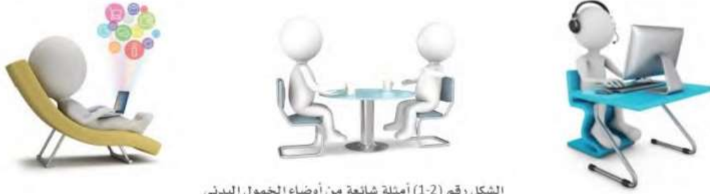
الشكل رقم (1-2) أمثلة شائعة من أوضاع الخمول البدني

المكافئ الأيضي (Metabolic Equivalent- MET) ، يعني مقدار الطاقة المصروفة من قبل الجسم منسوبة إلى ما يصرف أثناء الراحة. علماً بأن الجسم يصرف طاقة مقدارها (1) مكافئ أيضا في الراحة.