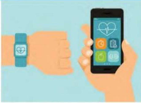
صورة رقم (2-8) يمكن متابعة وحفظ البيانات واسترجاعها من خلال تطبيقات على الساعة الذكية والهاتف الجوال